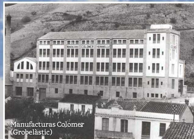
Manufacturas Colòmer (Gobelàstic)