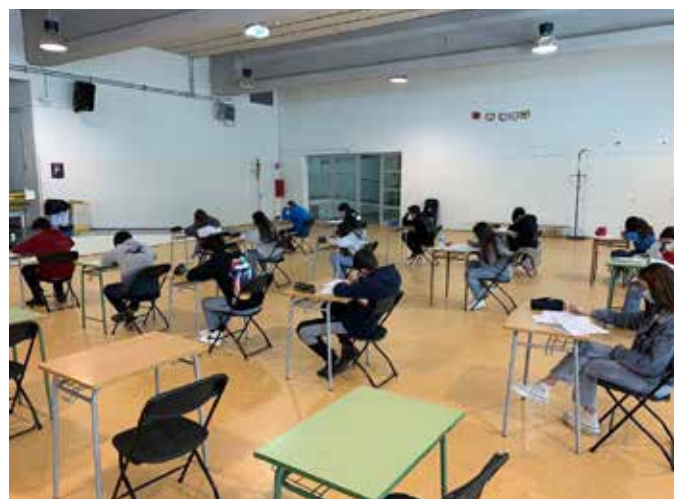
Proves Cangur adaptades a les mesures de la pandèmia