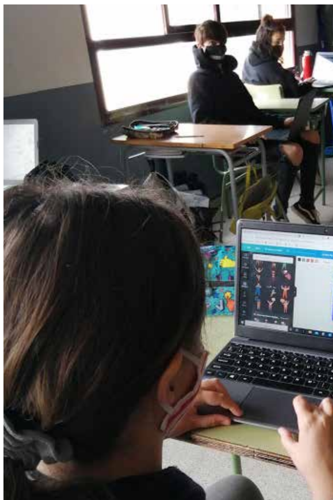
Una alumna fent un cartell amb l'eina Canva

Treballar amb ordinadors és una manera diferent d'aprendre i ens permet mantenir les mesures COVID. Ara ja ha esdevingut la nostra manera habitual de treballar. Una de les eines que més útils ens resulta és el Moodle, ja que és una manera digitalitzada d'entregar tasques o presentar les llibretes en fotos. Un altre entorn de treball que utilitzem és el Drive. Al Drive hi tenim documents compartits amb els quals podem treballar amb companys de manera col·laborativa, i així seguir fent treballs en grup.