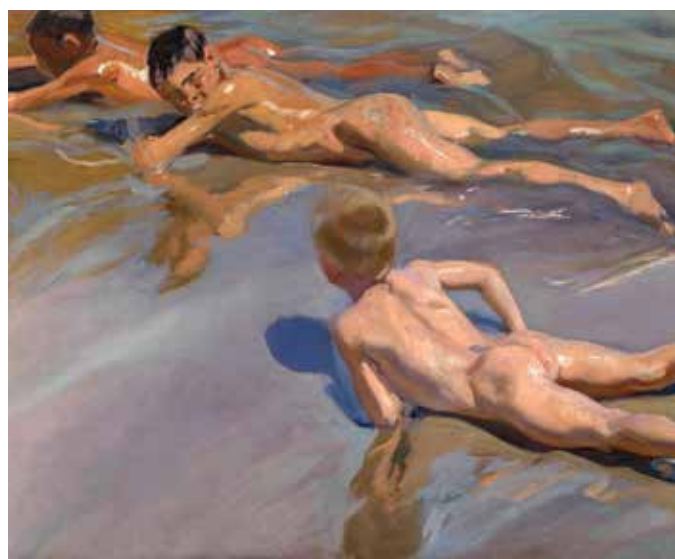
Nens a la platja, Joaquín Sorolla (1863-1923). Oli sobre llenç (1910): Museo del Prado, Madrid. Època postimpressionista.

Vet aquí un cant a la nostra infantesa: memòria d'una espontaneïtat sense límits ni prejudicis. Quantes rialles compartides, xipolleig incansable de peus i cames, d'una amistat trenada en la bellesa única de la natura. I, mentrestant, la brillantor suau del sol ombrreja la pell dels seus cossos. Sens dubte, el temps sembla aturar-se. Gaudiu-ne!