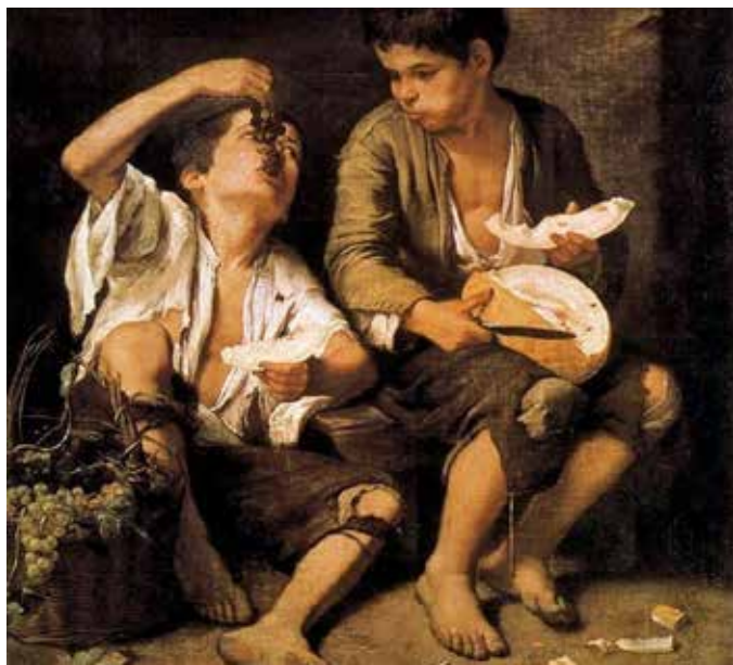
Nens menjant raïm i meló , Bartolomé Esteban Murillo (1618-1682). Pintura a l'oli (entre 1645 i 1650): Alte Pinakothek, Munic. Època barroca.

Quan no tens res, certament, és molt més fàcil gaudir dels petits plaers de la vida. Aquesta idea amaga la reivindicació de la felicitat que no és tangible ni mai evident. Murillo expressa la recerca d'allò més humà en el nostre viatge interior, el qual ens permetrà fruit de les coses més senzilles. L'artista pinta els nens marginats per manifestar l'afecte i la preocupació davant la pobresa del seu temps. Atès que dominava el dibuix, recrea el detall realista i en destaca l'expressivitat, els gestos, les mirades... Naturalitat i realisme s'ajunten per mostrar l'amabilitat dels nens i la denúncia de la situació. L'autor treballa els colors ocres a través d'un fons fosc i difuminat, on s'hi ressalten les figures i els aliments d'una llum que irradia la delectança d'una escena tan greu. Amb la tècnica del clarobscur, exalta la lluita entre la bondat natural dels nens i la seva desesperació menjant d'amagatotis. Dos amics en un carreró de Sevilla que posen de manifest, absents, la crua realitat del moment.