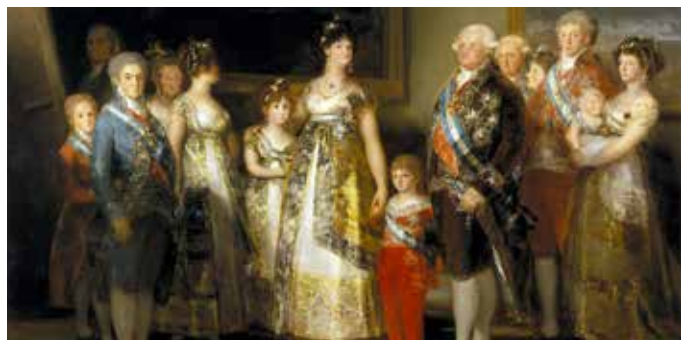
La família de Carles IV, Francisco de Goya (1746-1828). Pintura a l'oli (1800): Museo del Prado, Madrid. Època neoclàssica/romàntica.

Fins i tot, podem copsar un fil conductor entre els dos autors i les seves obres. Un cert paral·lelisme: ambdós van ser pintors de la cort i van ser subtilment crítics (cadascú a la seva manera) amb la situació que vivia el poble en els seus respectius moments històrics. Òbviament, fer esment a llums i ombres no només són tècniques pictòriques, sinó també missatges necessaris per a la història.