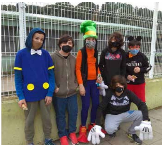
Un carnaval adaptat a la COVID-19 (1)

Aquest any, per celebrar el carnaval, ens hem hagut d'adaptar a la nova situació de la COVID-19 i pensar com es podria celebrar-lo d'una manera diferent, respectant les mesures de seguretat. Els delegats de 4t ens vam reunir i vam decidir que, tot i ser un any amb dificultats per poder fer segons quines activitats, buscaríem la solució per poder celebrar mínimament la festa del carnaval. Vam pensar que la millor opció era fer una activitat en què els alumnes poguessin concursar dins de l'aula i no es barrejessin amb els alumnes d'altres classes; per això vam crear un escape room.