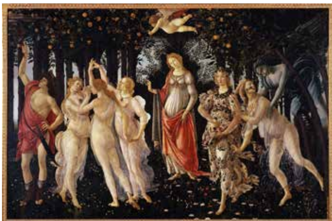
La primavera, Sandro Botticelli (1445-1510). Tremp sobre fusta (pels volts de 1482): Galleria degli Uffizi, Florència. Època renaixentista italiana.

La iniciativa ha fet que l'activitat fos molt participativa (i creativa!), la qual cosa ha servit per adonar-nos com les expressions de la cara, les posicions corporals o les mirades poden transmetre emocions que es plasmen en el quadre. En darrer terme, també hem volgut posar èmfasi en la màgia de poder explicar històries sense paraules.