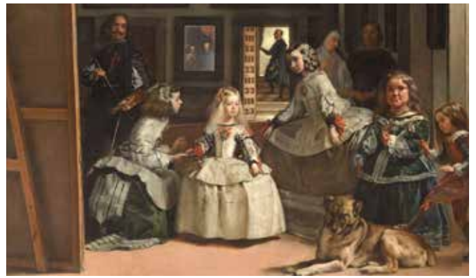
Les Menines o La família de Felip IV, Diego Velázquez (1599-1660). Oli sobre llenç (1656): Museo del Prado, Madrid. Època barroca.

Per exemple: l'autoretrat de Velázquez, la situació dels reis en el mirall de fons (que veritablement estan davant) i amb la resta d'escenes, converses i figuracions que envolten la Infanta (especialment, les menines ). L'autor ens convida a imaginar allò que està pintant, ja que l'escena que mostra és tot un altre espectacle. Al capdavall, som nosaltres els que estem davant i els reis de rerefons. De fet, hi ha tota una teoria social amagada aquí darrere: tota una inversió i trasbalsament que obre la porta a una ficció imaginativa sempre a redós de la realitat. Talment com si el pintor volgués posar cada cosa al seu lloc, bo i mostrant la realitat en tota la seva amplitud.