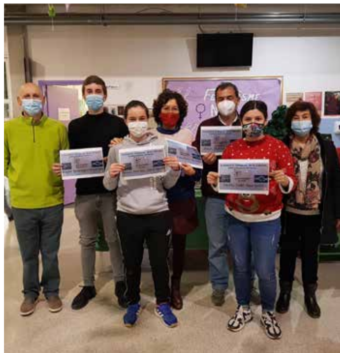
Liurament de diplomes als guanyadors de la Setmana de la Ciència de la categoria alumnat i professorat

La setmana de la ciència la dediquem íntegrament a la ciència. Aquest any, a causa de la COVID-19, hem trobat a faltar els experiments i pràctiques que usualment fèiem. Però per reemplaçar aquestes activitats els professors de ciències van organitzar un concurs en línia en què ens feien diàriament preguntes variades sobre ciència, i les persones que acumulaven més encerts sumaven punts fins a guanyar.