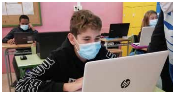
Dos alumnes en una classe de competència digital

Aquest any, durant les portes obertes, no hem pogut ensenyar l'Institut, com ens hauria agradat, però hem aprofitat els avantatges de les eines digitals per arribar a tothom. Així que els alumnes de 2n d'ESO hem dissenyat un recorregut virtual per l'Institut explicant cada una de les aules i una mica les matèries. Ho hem explicat en dos vídeos, un de TV Arenys de Munt i un altre elaborat des de la matèria de competència digital.