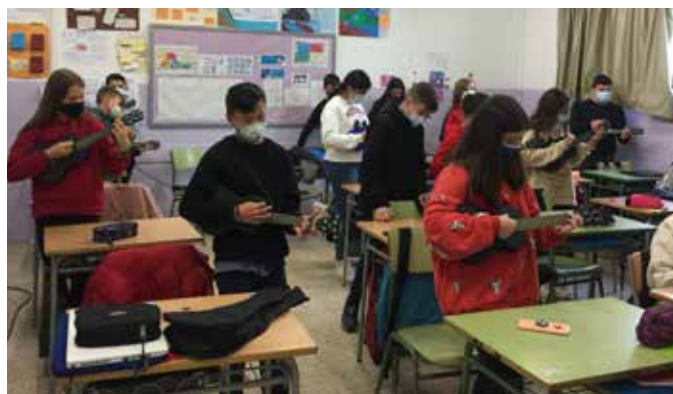
Alumnes de 1r d'ESO tocant l'ukelele