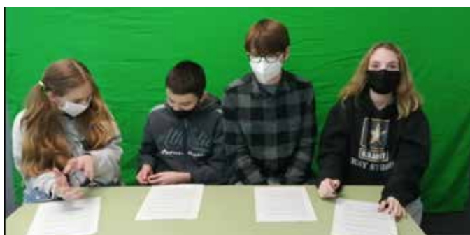
Gravació del projecte de competència digital de 2n d'ESO