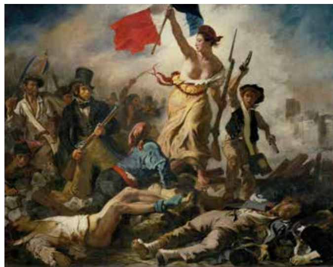
La llibertat guiant el poble , Eugène Delacroix (1798-1863). Pintura a l'oli (1830): Musée du Louvre, París. Època romàntica.

I fondly remember my history and art history teachers. They used to say that everything is cyclical. In recent years, we have lived through the revolts of the Arab Spring and, much closer, our own Catalan Revolution. In all of them, there have been similar feelings of perception of freedom. Unfortunately, sometimes, you cannot escape the reality of the world, and that is when we enter into disappointment and anguish... So, is Romanticism back?