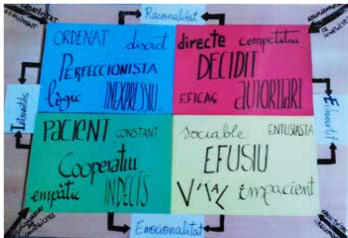
Educació emocional: pòster amb les característiques relacionades amb els colors