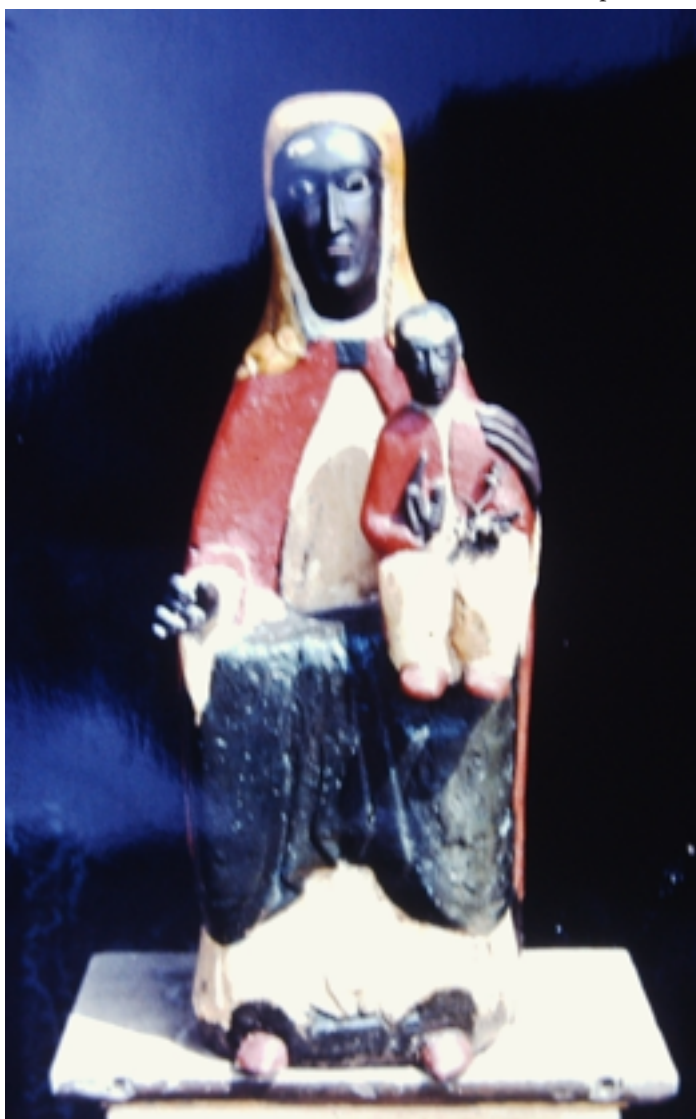
Talla de la marededéu de Valldemaria

Vall Maria se troba a poca distància del límit de la província de Barcelona a mà dreta, seguint la carretera envers Girona. En lo fondo d'aquella vall aspríssima, coberta per tot arreu d'alzines sureres, hi ha una pobra masia, pertanyent a la gran heretat que en los termes de Maçanet i de Tordera posseeix lo Sr. de Borràs i de Jalpí. Hi baixí lo dia 22 de setembre del corrent any [1887], i havent preguntat si existia algun vestigi del monestir de què tractaré més endavant, m'ensenyaren una capella, que es creu ne formava part, actualment destinada a graner. A pocs passos de la casa, traspasat un regueró, s'hi veuen uns restos de paret que per llur gruixària i forma circular semblen los fonaments d'una torre; emperò lo vell masover, no sé ab quin grau de certitud, m'assegurà que tals vestigis eren d'un molí ( Butlletí , n. 109-110, octubre-novembre de 1887, p. 187-188)(3).