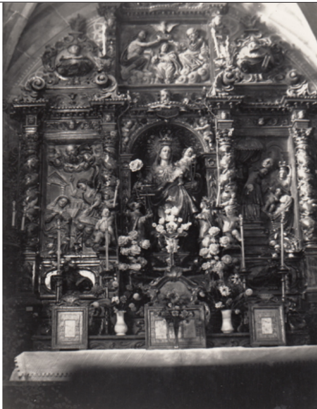
Altar del Roser.

d'aquell estil artístic. Aquest retaule va arribar fins als disbarats de 1936.