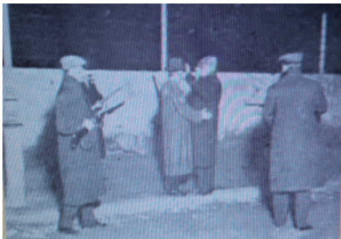
Patrulla de sometents escorcollant un vianant