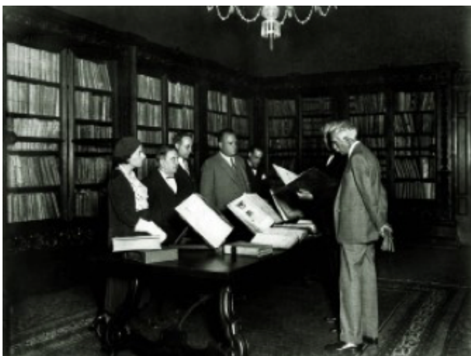
Visita del president Macià a l'Arxíu Històric de Barcelona. Octubre de 1931

La gestió dels documents electrònics, en el marc dels tràmits sense paper, obliga també a assegurar el valor de l'eficàcia jurídica, i, sobretot, la preservació de la informació digital. Aquest és el gran repte que tenim els arxius en el segle XXI, estar dotats de les eines per assegurar que els ciutadans puguin accedir als fons dels arxius tant des de casa, amb total comoditat, o bé presencialment a les sales de consulta dels arxius.