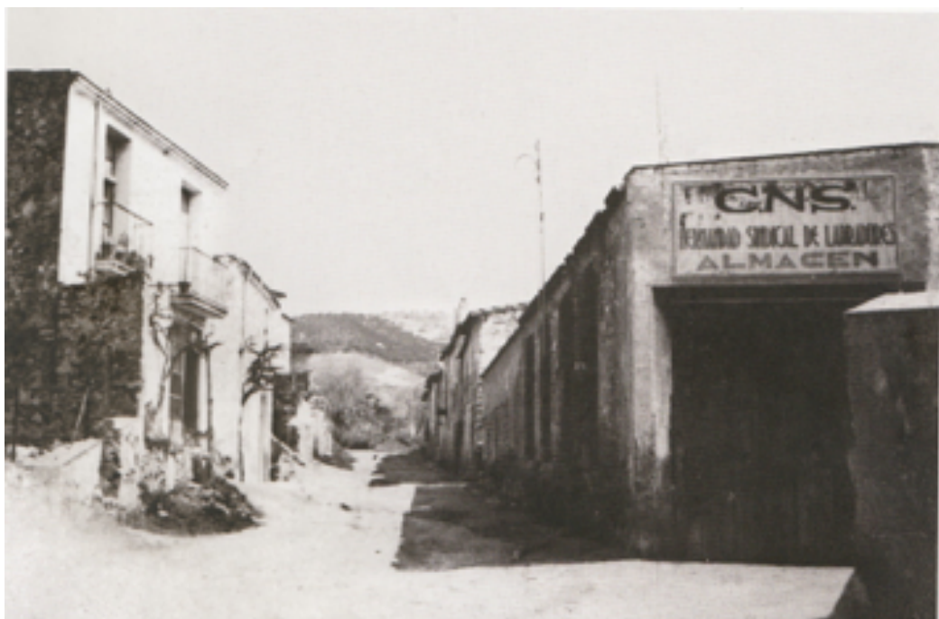
Edifici del Sindicat Agrícola als anys 40. Rial Pasqual

El 18 de maig de 1937, el consell municipal d'Arenys de Munt contestà la demanda que se li havia fet per tal de desinfectar els locals destinats a l'aquartermament dels soldats. Els edificis desinfectats foren el local del Sindicat Agrícola, al rial Pasqual, i la fàbrica Manufacturas Colomer SA, en aquells moments sense cap mena d'activitat industrial i en part ocupada pel Sindicat de pagesos. Una setmana més tard, el 24 de maig, el consell rebia la notificació de la Inspecció general de control, alistament i instrucció, encara dependent