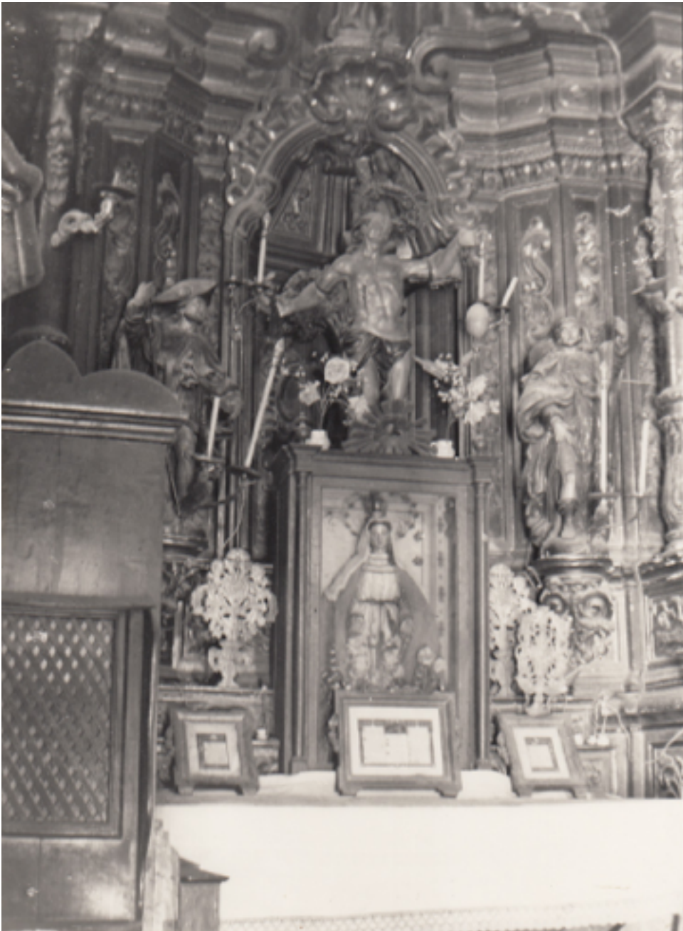
Altar de Sant Jaume, Sant Sebastià i Sant Roc.

L'altar del Roser s'ubicà a la planta inferior del campanar, un espai que fins aquell moment havia estat ocupat per la capella dedicada al Sagrat Cor de Crist i als sants Abdó i Senén (FORN, 2019), uns sants que ara s'havien incorporat a l'Altar Major. El retaule del Roser fou construït el 1571. Un any després, el 1572, Ramon Puig, pintor, va rebre la quantitat de 68 lliures "per pintar un retaule de la Verge Maria del Roser"(2). El 1626, Gue- rau Vilagran va esculturar una imatge de la Verge del Roser (PONS, 1944: 25). Aquest altar fou renovat completament a final del segle XVII, i substituït per un nou altar amb un retaule que era una delicada i esclatant mostra d'art barroc amb tots els elements representatius