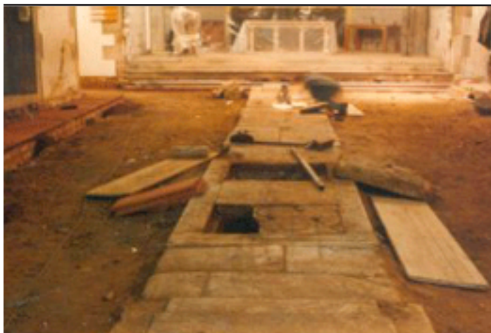
Part superior de la cripta

seu voltant amb motius vegetals; el símbol de la mort ocupava l'espai central de la tapa.