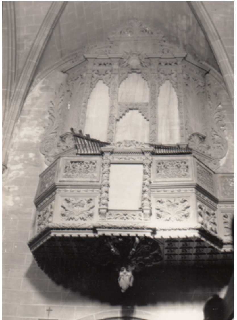
Orgue del segle XVIII.

És força probable que s'aprofitessin les velles campanes de l'església romànica per ubicar-les en el nou campanar. A mitjan segle XVIII foren substituïdes