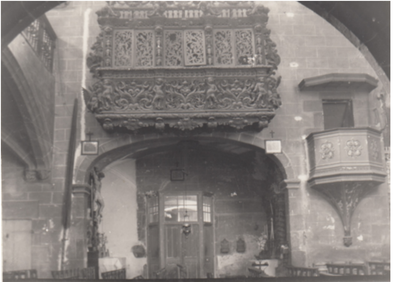
Tribuna dels Vilarrassa, altar del Sant Crist, altar de Sant Antoni de Pàdua i trona.

Comunidor. El comunidor era un element imprescindible en els temples parroquials del segle XVI. Habitualment era una construcció quadrangular, oberta als quatre vents i ubicada a l'exterior i prop de l'entrada de l'església parroquial, tot i que també trobem comunidors a les parts altes dels campanars amb finestrals oberts en cadascun dels punts cardinals des d'on es podia tenir una visió quasi sencera del terme parroquial. La seva funció era molt clara: des del comunidor, el capellà seguint un ritual establert exorcitzava qualsevol dels desastres que podien afectar la comunitat, ja fossin tempestes, desastres naturals, guerres, pestes o la mateixa presència de bruixes, bruixots o del maligne.