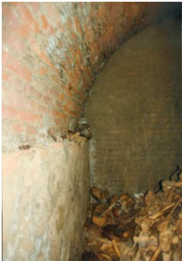
Interior de la cripta central

A la segona meitat del segle XVII, però, i probablement amb la finalitat d'obtenir recursos per a l'obra, s'inicià la construcció d'una cripta al subsòl de la nau central del temple. La intenció era oferir la possibilitat que, mitjançant un determinat pagament, tothom