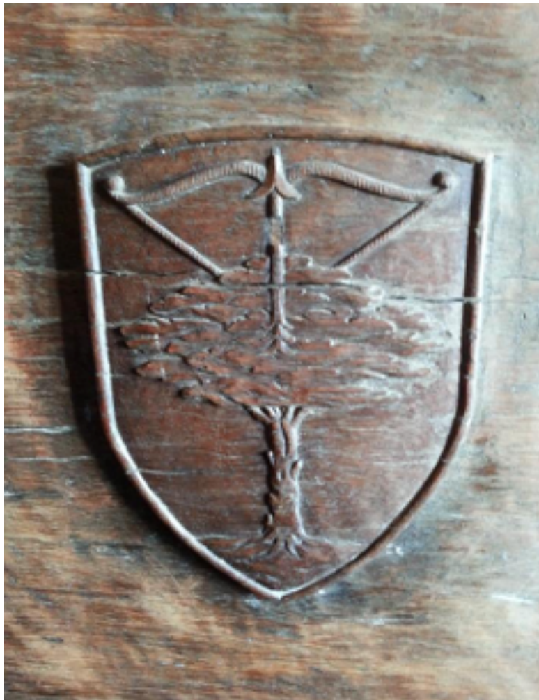
Escut dels Arquer