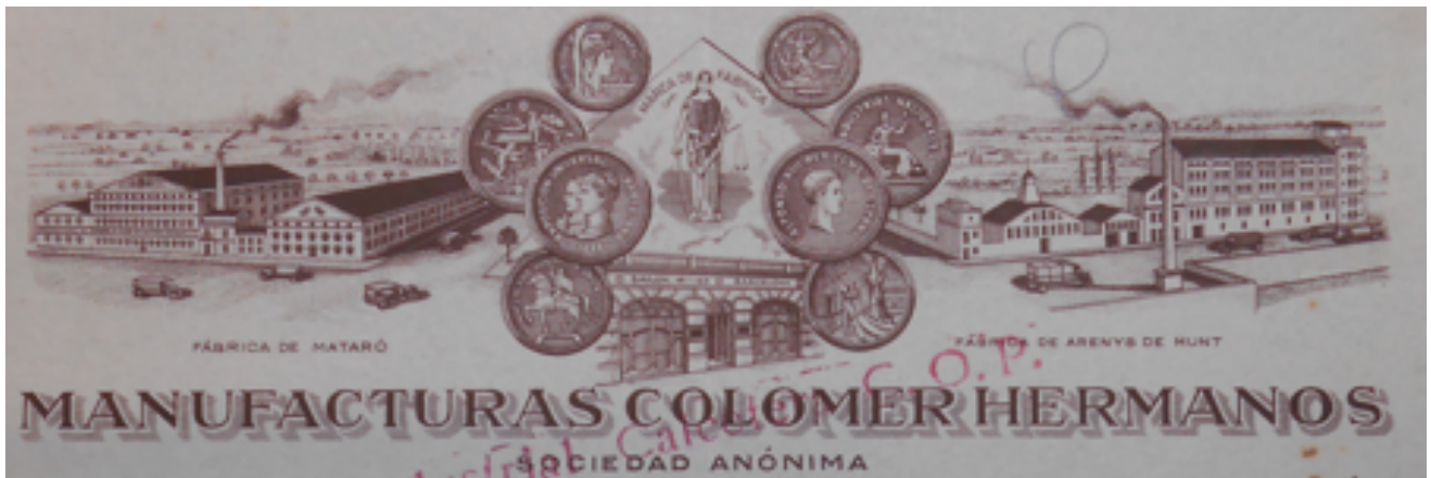
Capçalera dels impresos que feia servir l'empresa Manufacturas Colomer Hermanos SA