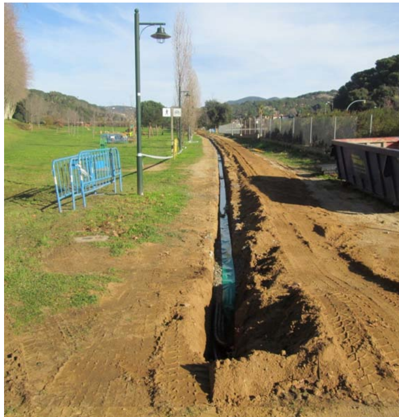
Rasa al Parc Can Jalpí per permetre l'obra civil per instal·lar tubs de banda ampla

Per a més informació sobre la xarxa podeu consultar el següent enllaç http://www.ccmaresme.cat .