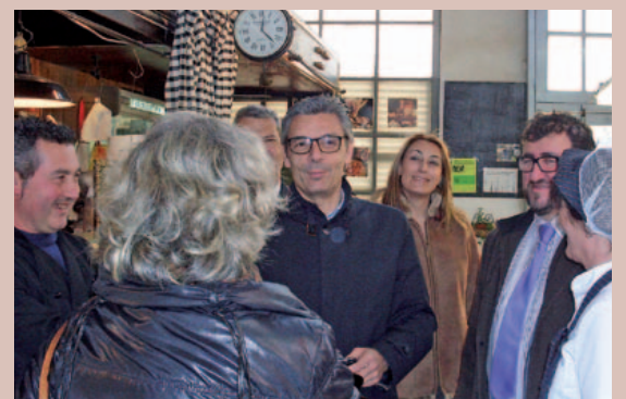
El diputat de Comerç, acompanyat del 1r tinent d'alcalde i paradistes del mercat municipal

L'any passat es van destinar 24.675,63 € del pressupost municipal a la dinamització del comerç, fires i mercats, als que cal afegir el suport material i de la brigada.