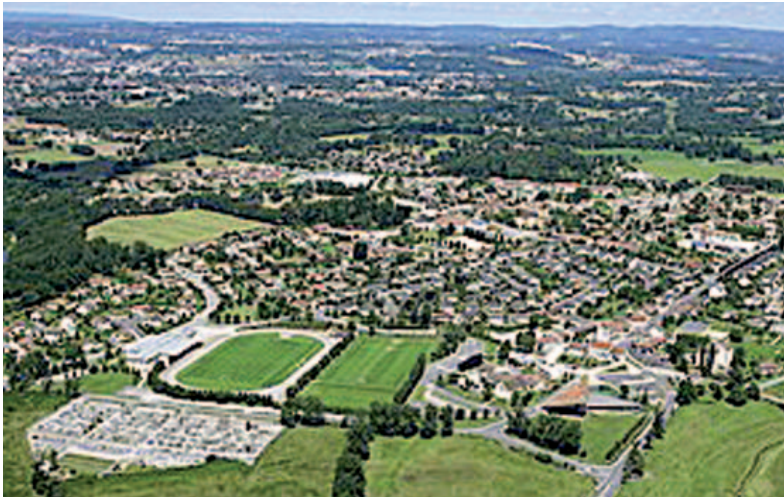
Vista des de l'aire del municipi de Feytiat

Aquest any celebrarem a Arenys de Munt diversos actes per commemorar el 15è aniversari de l'agermanament amb Feytiat.