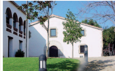
Masia de Can Borrell

Un dels propòsits de la Regidoria de Cultura és l'endreaça de la masia de Can Borrell. Es pretén que sigui un espai cultural viu, dinàmic i obert, on els diferents racons mostrin elements culturals de la vila, a més d'oferir els espais per a diferents actes o reunions de les entitats del poble.