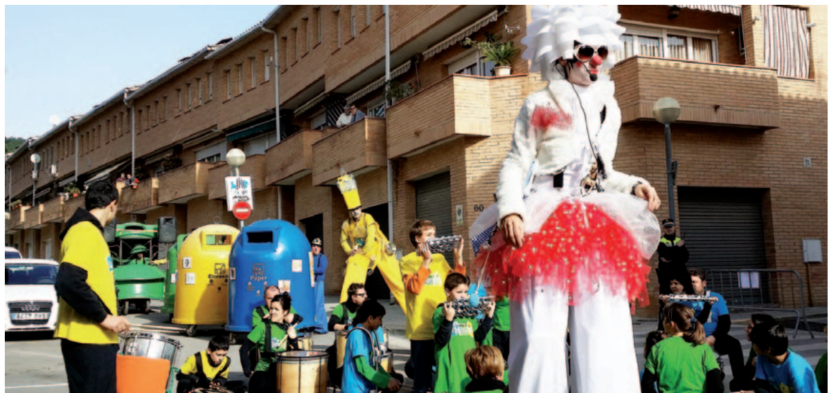
La Cercavila ambiental va fer-se sentir al seu pas pels carrers d'Arenys de Munt

el 74% de les quals les respostes a les 5 preguntes que es feien eren totalment correctes. El tractament de la fracció del rebuig és el que genera més despesa econòmica a l'Ajuntament i aquest és un dels motius pels quals des del govern municipal s'impulsa la reducció d'aquesta fracció de la brossa. Reciclar bé, a més del valor mediamiental que representa, comporta un estalvi al servei de recollida de brossa, la qual cosa pot repercutir favorablement en el rebut.