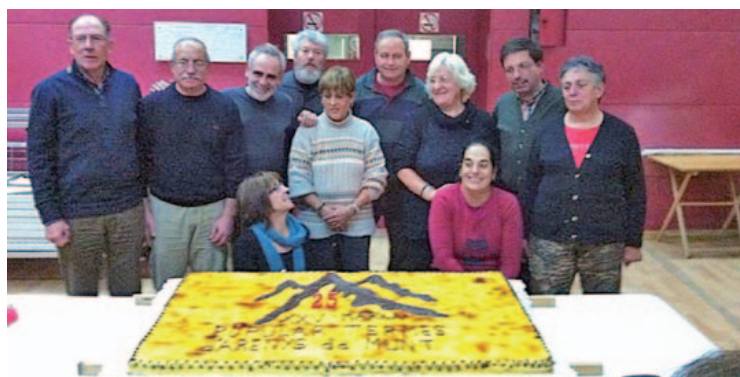
Muntanyencs de la vila en la celebració del 25è aniversari amb un gran pastís

El dissabte 30 de novembre, a la Sala Municipal es va celebrar el sopar anual de la Marxa Popular d'Arenys de Munt, organitzat pels Muntanyencs de la vila. Aquest any es va celebrar el 25è aniversari