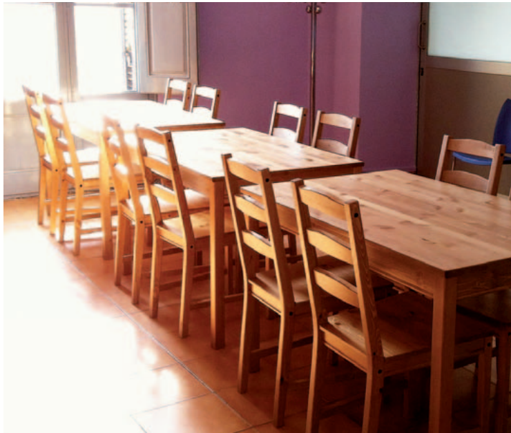
Una imatge renovada de l'espai després de les obres d'arranjament

S'han iniciat unes obres d'arranjament i millora de l'Esplai Verge del Remei. La primera actuació ha estat a la sala del costat dels ordinadors on s'ha endreçat l'espai amb nova pintura i enllumenat