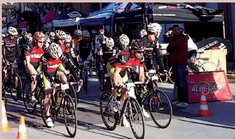
Més de 1.200 ciclistes es van aplegar a Arenys de Munt

Diumenge 16 de març es va celebrar a Arenys de Munt la 3a edició de la marxa cicloturista Ports del Maresme, que va batre el rècord de participació amb 1.200 ciclistes i més de 2.000 visitants. En aquesta tercera edició, s'ha pogut assolir el recorregut desitjat, tot transitant per pobles de gran interès cicloturístic com és Gualba, i el Parc Natural del Montseny. La prova va cons-