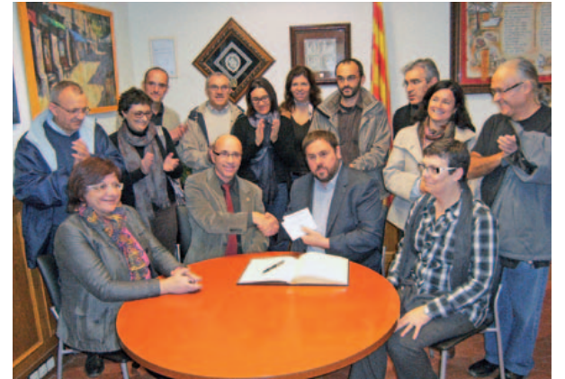
Oriol Junqueras en el moment de la signatura al Llibre d'Honor de la vila amb el govern municipal, regidors i representants de Centre Moral, l'ANC i l'Ateneu Independentista d'Arenys de Munt

El 15 de setembre, Carme Forcadell, presidenta de l'Assemblea Nacional Catalana, va ser rebuda a l'Ajuntament per l'alcalde, regidors, l'ANC d'Arenys de Munt i l'Ateneu Independentista d'Arenys de Munt i va signar al Llibre d'Honor de la vila. La visita de la presidenta de l'ANC estava prevista dins els actes organitzats per l'Aplec per la Independència en commemoració de la primera consulta del 13 de setembre de 2009.