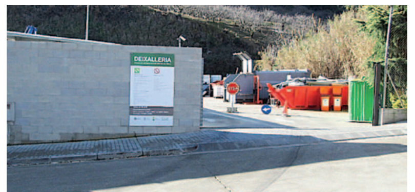
El veïns i veïnes d'Arenys de Munt ja poden gaudir d'una bonificació en la taxa de la brossa fent aportacions a la Deixalleria mancomunada

Tarifa II. Habitatges caràcter familiar, amb ús de la deixalleria: 100,99 €