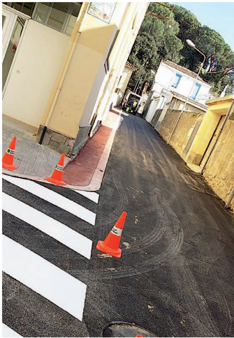
Passatge Cotxeria, un cop acabades les obres d'arranjament

Cotxeria és un dels carrers més transitats del municipi i per això el paviment estava malmès i no hi havia cap pas per als vianants. Aquesta actuació de la Regidoria d'Obres i Serveis el millora notablement i dona resposta a una demanda de la ciutadania, a més de la demanda de connexió de les aigües pluvials realitzada en el Consell d'Urbanisme.