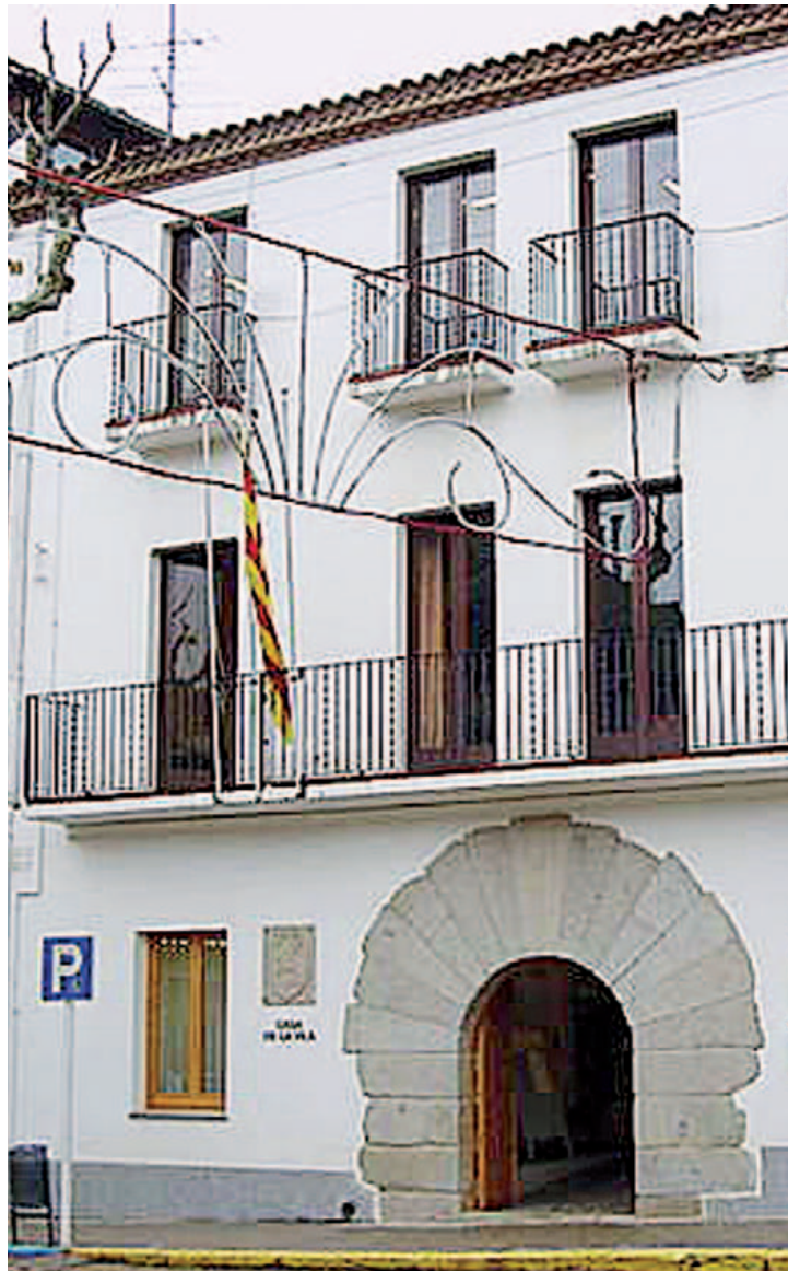
Façana de l'ajuntament d'Arenys de Munt

L'alcalde d'Arenys de Munt, en un dia transcendent per a la història de Catalunya com el passat 12 de desembre, quan el President de la Generalitat va fer pública la data i la pregunta, va agrair el consens assolit per CUP, ERC, CiU i PSC en aquesta declaració i el compromís del consistori amb la democràcia.