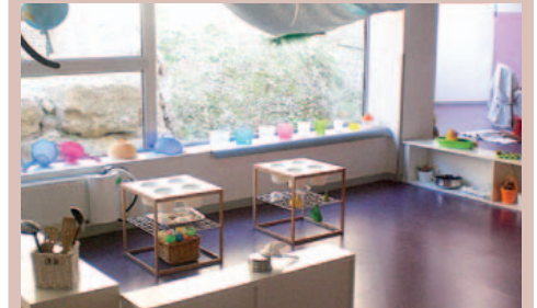
L'escola bressol un exemple de projecte innovador

Cal destacar la gestió de l'escola bressol La petjada premiada pel seu projecte